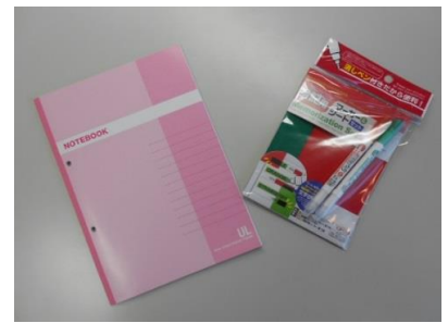
暗記用のペン・ノート